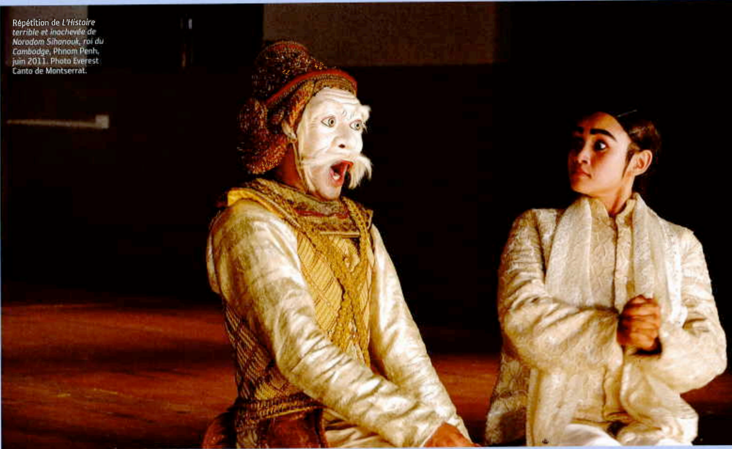
Répétition de L'Histoire terrible et inachevée de Norodom Sihanouk, roi du Cambodge, Phnom Penh, juin 2011.