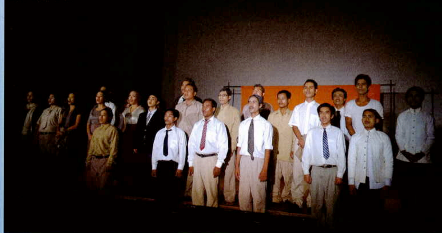
Scène finale (répétition, février 2011).

l'Indien Nehru, l'Indonésien Soekarno et le Chinois Zhou Enlai. Parallèlement à ses fonctions de chef d'Etat, il compose des chansons, écrit et réalise des films, avec le Cambodge comme personnage principal. Avant l'arrivée des Khmers rouges, en 1970, le Roi est renversé par un coup d'Etat, fomenté par son Premier Ministre, Lon Nol, fort de l'appui des forces américaines, et manipulé en coulisses par Sisowath Sirik Matak, prince héritier autrefois éconduit par les puissances internationales au profit de Sihanouk. Le Roi trouve alors refuge à Pékin, où il s'allie avec les communistes cambodgiens, ses anciens opposants, qu'il avait lui-même baptisés les Khmers rouges. Très vite, cette République du Cambodge périclète et, faisant le lit de la contestation, prépare l'arrivée des Khmers rouges, qui se servent de Sihanouk comme d'une vitrine pour susciter l'adhésion populaire. Il faut dire que Nixon et Kissinger n'y étaient pas allés de main morte pour tenter d'éradiquer leurs ennemis vietnamiens au Cambodge : 2 millions de tonnes de bombes déversés en 1973... Formées au maoïsme et à la guérilla, ces forces révolutionnaires prennent Phnom Penh